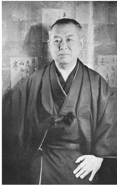
Junichirō Tanizaki (1896-1965)

És considerat per molts com la pedra angular de la novel·la contemporània del Japó, juntament a figures decisives com Ōgai Mori, Natsume Sōseki, Ryūnosuke Akutagawa, Yasunari Kawabata, Yukio Mishima i Kōbō Abe. Tanizaki ha jugat un paper clau en el dramàtic entrecreuament de la cultura i l'art entre Orient i Occident, en la modernització-devastació del segle XX. El 1949 se li atorgà el premi imperial de literatura.